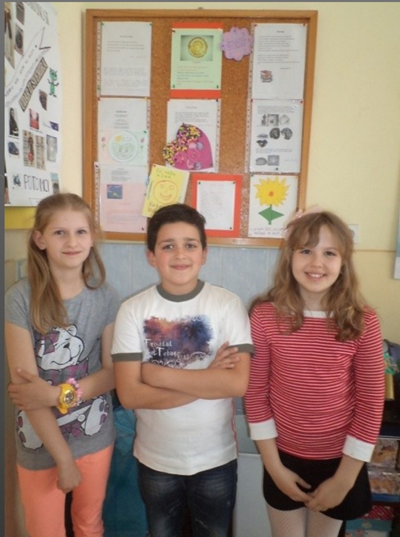
▣ Učenci IV razreda